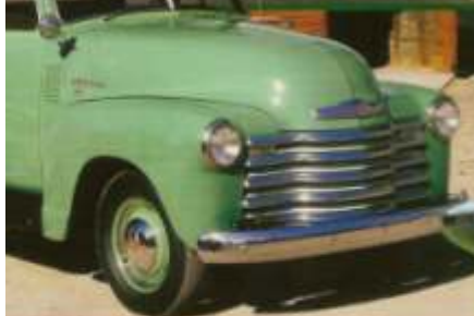
Werkpaarden van Chevrolet