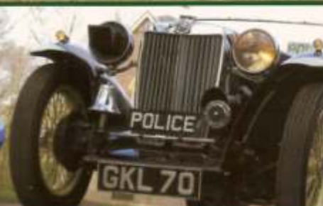
MG TB in politie-uitvoering