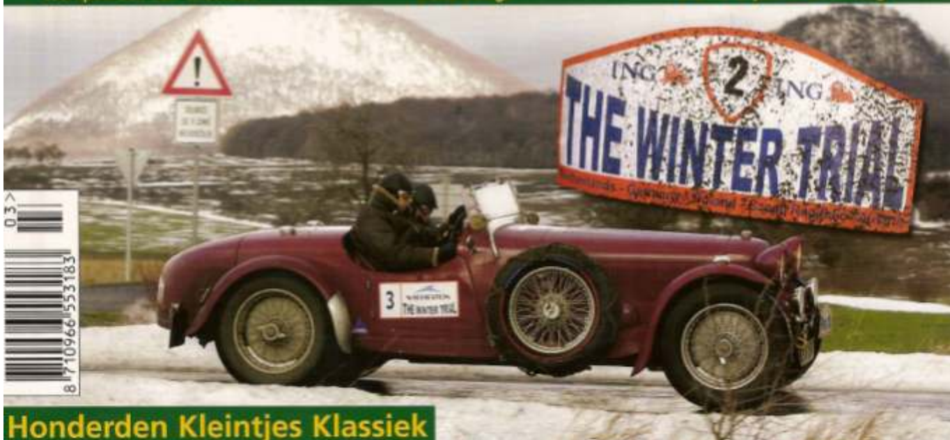
Honderden Kleintjes Klassiek